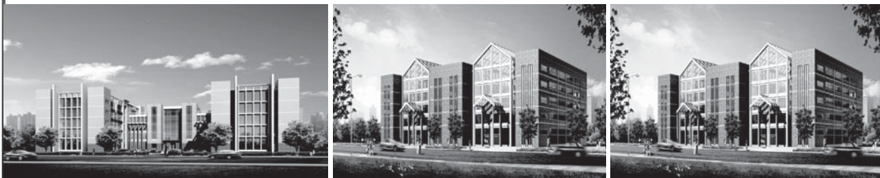
上海名特農產品國際物流與交易基地設臺灣、非洲、南亞等場館