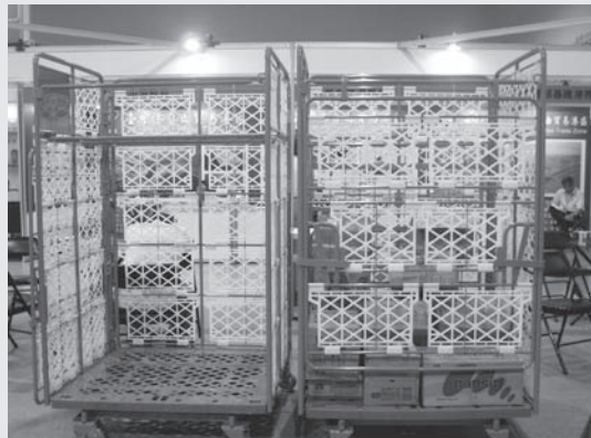
展出產品為物流台車、巧固架、新型摺疊籠、倉庫。