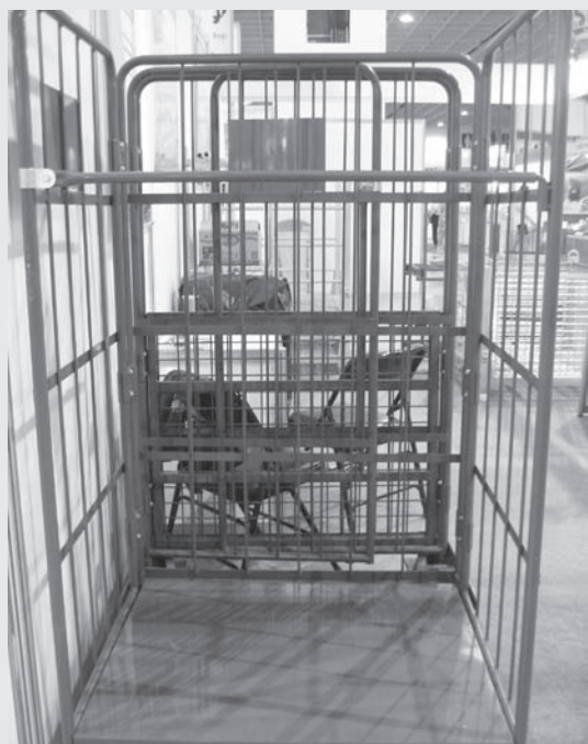
展出產品為倉庫籠、物流台車、工具箱。