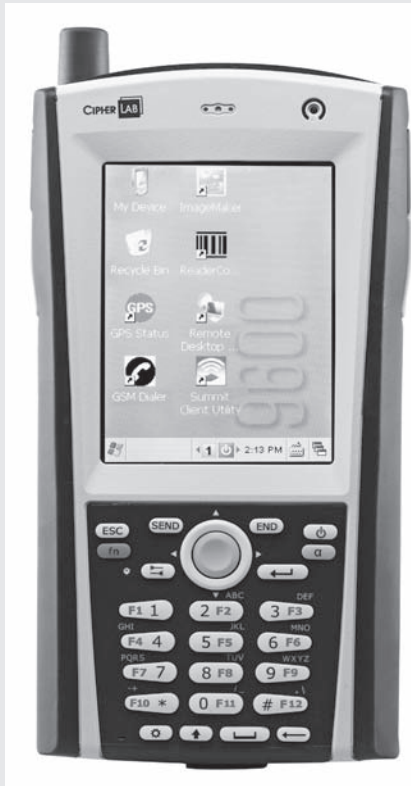
展出產品為移動電腦、掃瞄器。