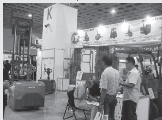
展出產品為桅桿前移型電動堆高機、交流電AC無段式全電動拖板車。