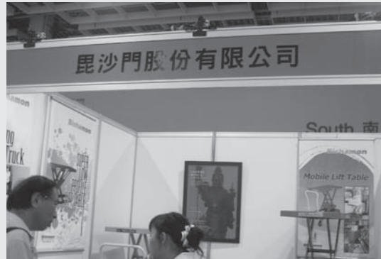
展出產品為油壓升降台車、電動油壓升降台車、電動油壓升降平台。