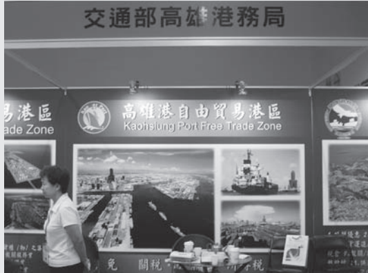
展出產品為海港自由貿易港區聯合招商。