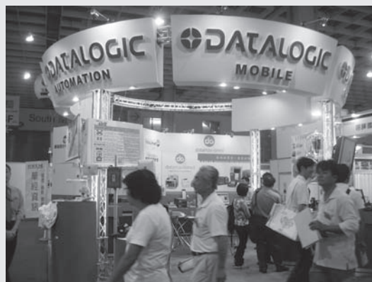
展出產品為Datamax條碼標籤印製機、Datalogic條碼讀碼器、RFID設備、CODESOFT條碼編輯軟體、現場資訊設備整合系統、自動印貼標機設備。