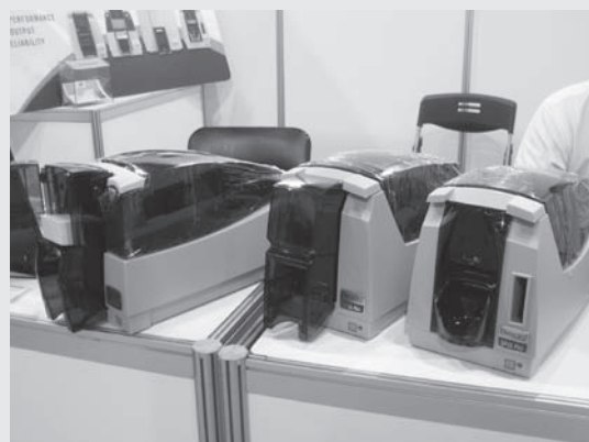
展出產品為彩色相片/證照印發卡系統。