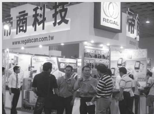
展出產品為手持/固定式一維二維條碼掃瞄器、掌上型終端機/盤點機、條碼標籤列印機、RFID讀取器/RFID標籤等。