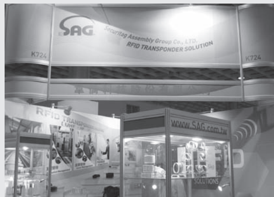
展出產品為RFID標籤、非接觸式感應卡等。