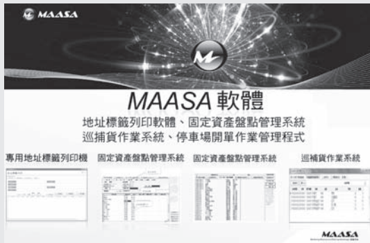
展出產品為Honeywell 全系列掃描器、工業型掌上型電腦軟體應用整合方案。