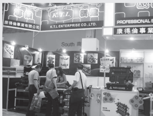
展出產品為工具車、手推車。