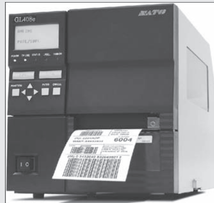
展出產品為條碼機、掃瞄器、盤點機、條碼貼紙、碳帶。