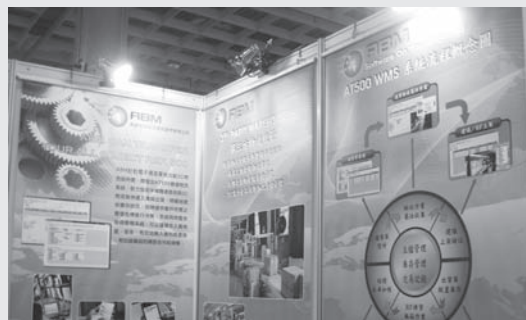
展出產品為物流管理系統、物流專案顧問、庫存代管服務。