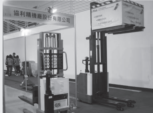
展出產品為調整型托板車、油壓托板車、半電動托板車、堆高托板車等。